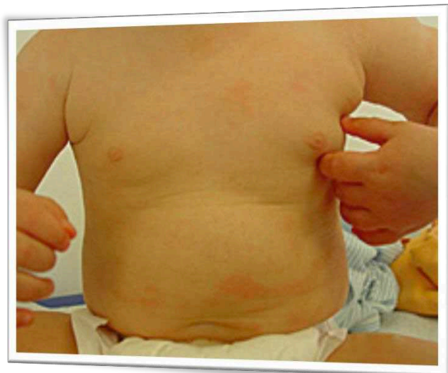
Neurodermitis im Kindesalter

verfasst von: Dr. Claudia Triendl Fachärztin für Haut- und Geschlechtskrankheiten · Lofererstraße 42 a A-5760 Saalfelden